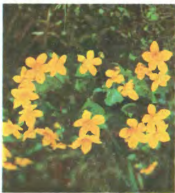
197. Калюжниця болотна.